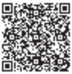
온라인 신청서 QR 코드